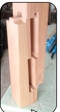
金輪継ぎは このように 組んでいます

上村神社(かむらじんじゃ:通称おしゃもじさま) 社宮司神(しゃぐうじのかみ)を祀っております。御社宮司神(おしゃぐうじのかみ)とも呼ばれたことからおしゃもじさんとなったようです。 創建は不明ですが、文化四年(1807年)に再造営されたと石灯笼に刻んであったそうです。